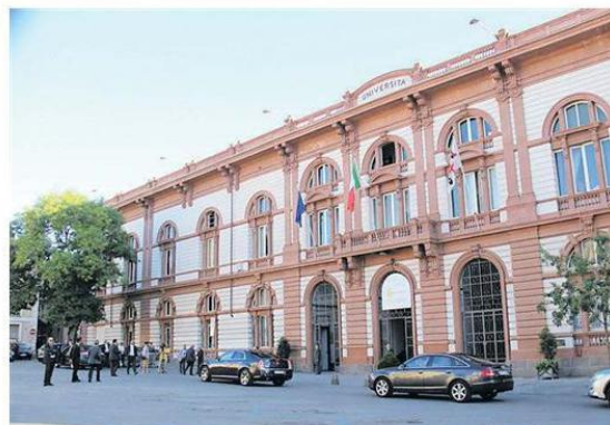
La facciata della sede centrale dell'università